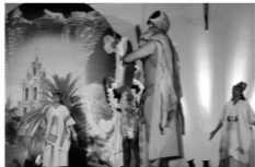
GRUPO DE MEXICO

Cada noche unas 3.000 personas disfrutaron sentadas de actuaciones en vivo de grupos de coros y danzas de distintos países y cuatro comunidades autónomas los que pasaron también por el escenario.