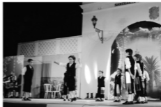
En la imagen niños de la Agrupación de Trujillo y Sierra de Fuentes.

Esta gala estuvo llena de sonrisas y anécdotas al ver bailar a los niños y niñas.