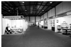
Panorámica de algunos de los stand del encuentro de artesanía Extremo-Alentejano.

Aprovechando la visita de nuestro grupo amigo y ya hermano, Volkstanzgrupe de Neckartaiflingen, se llevó a cabo la inauguración de la calle con el nombre de su ciudad, situada en la nueva urbanización del antiguo recinto ferial.