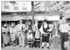
Apertura de Alcorcón 2007

De este modo, la asociación comienza a poner su ilusión y dedicación fundamental en el folklore de la Comunidad de Madrid, recopilando en la más pura esencia y fidelidad la cultura transmitida por sus pueblos para divulgarla por toda la geografía española e internacional.