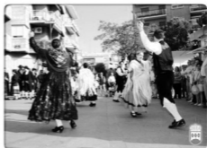
Ayuntamiento de Alcorcón 2007

de Alcorcón. En la que ha sido la XVII edición pudimos disfrutar de los grupos "Castiella" de Cabezón de Pisuerga (Valladolid) y el grupo "Prado de Santa Ana" de Madridejos (Toledo). Tras el pasacalles previo, fuimos recibidos en el Ayuntamiento por las autoridades municipales, para desde allí, dirigirnos al Teatro Municipal, donde pudimos disfrutar de más de dos horas de folklore los grupos, y con nuestra contribución con el folklore tradicional madrileño y lo mejor de la escuela bolera y goyesca.