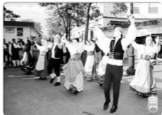
Ayuntamiento de Alcorcón 2007