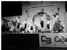
En la imagen, agrupación de Monzón (Huesca)

El grupo juvenil viajó este verano a Mora (Toledo), como intercambio con el grupo de esta ciudad.